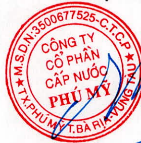
ĐINH CHÍ ĐỨC